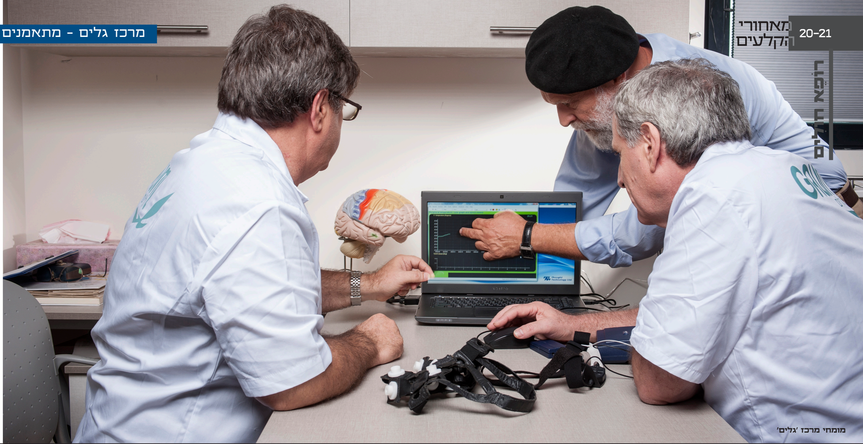
מומחי מרכז גלים